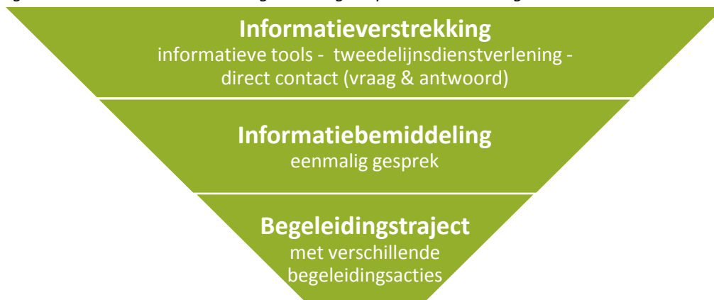
Figuur 1: schematische voorstelling van het getrapte dienstverleningsmodel

De verschillende trappen van de dienstverleningen passen in een trechtermodel waarbij het grootste aantal volwassenen op het eerste niveau, door middel van informatieverstrekking, bediend wordt, een beperkter aantal naar informatiebemiddeling doorstroomt en een minderheid in een begeleidingstraject instapt. Dit getrapte model laat toe om de dienstverlening voor een breed publiek uit te bouwen.